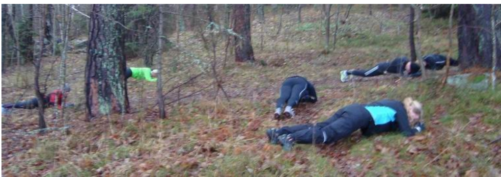
... på spridda platser i skogen