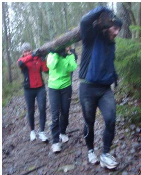
... gemensam vandring med stock