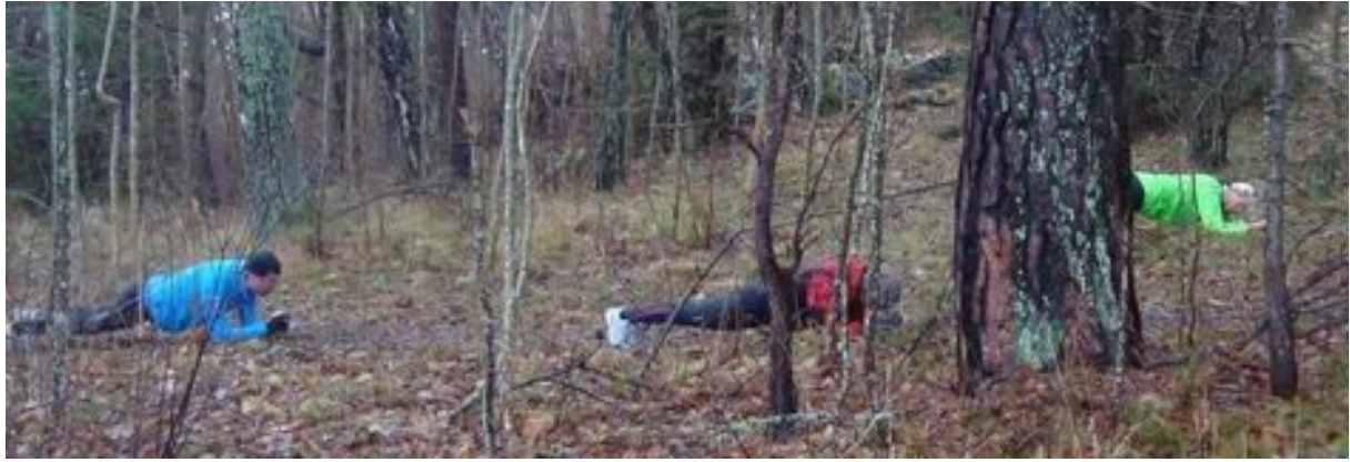
Rygg & magövningen "Plankan" ...