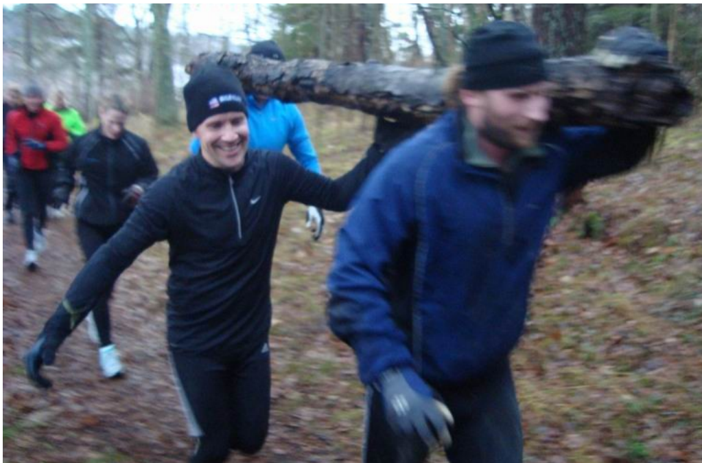
... efterföljs av manlig löpning med stock ...