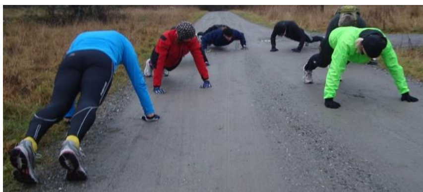
Uppvärmning som föregicks av lätt jogg med uppsträckta armar