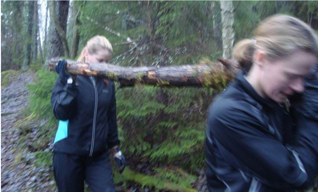
... kvinnlig löpning med stock samt ...